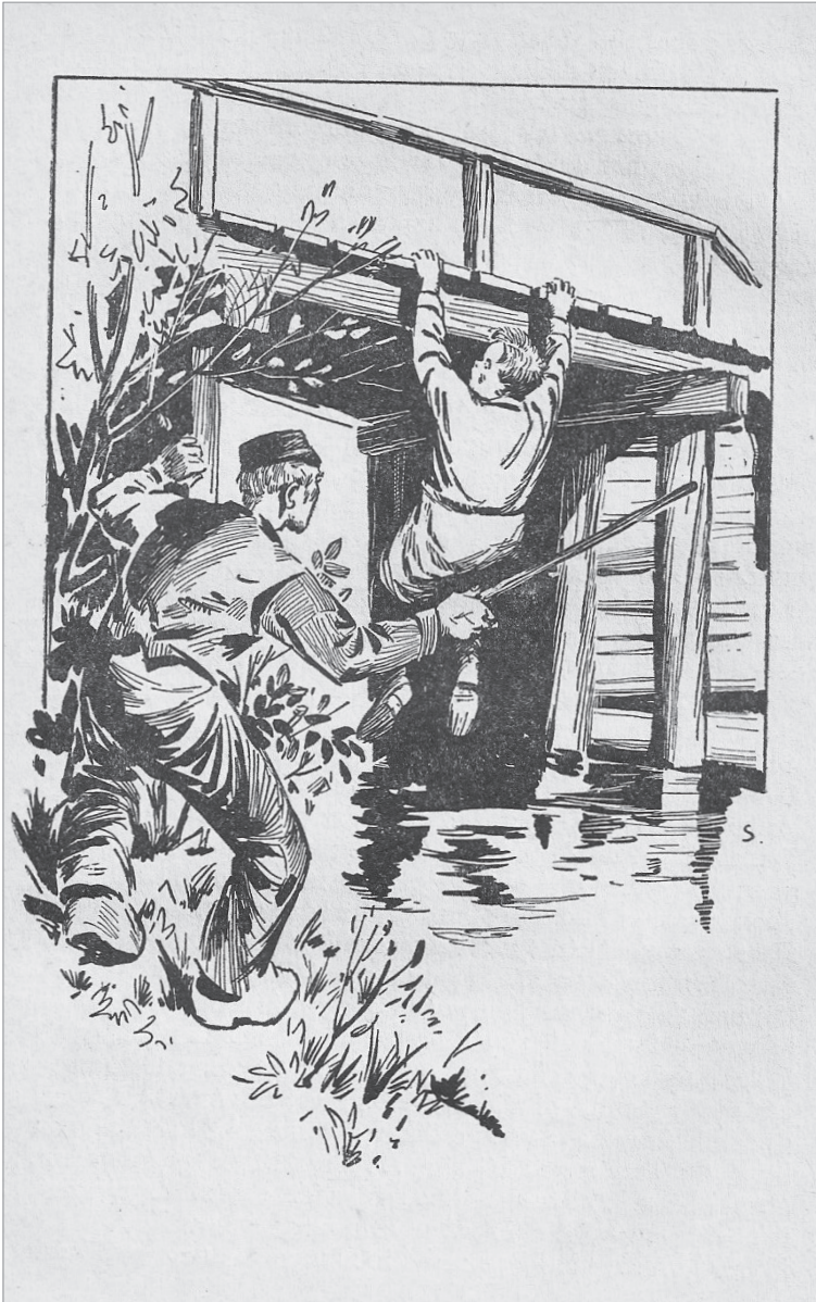
Illustratie van Sierk Schröder voor: W.G. van de Hulst, Jaap Holm en z'n vrienden , uitg. Callenbach, 17e druk, 1958